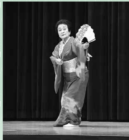
↑「花は咲く」に合わせた踊りを披露