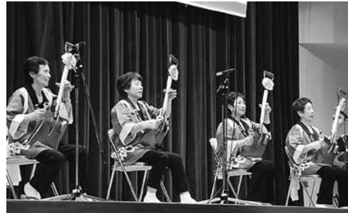
↑畑谷芸能愛好会によるスコップ三味線