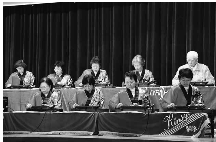
↑琴修会による大正琴の音色に聞き入りました