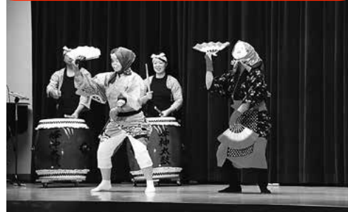
↑「ひよつとこ」と「おかめ」のひょうきんな動きに会場は笑いの渦に