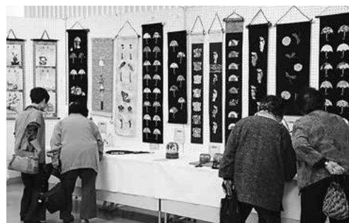
↑展示作品の出来映えに感心していました