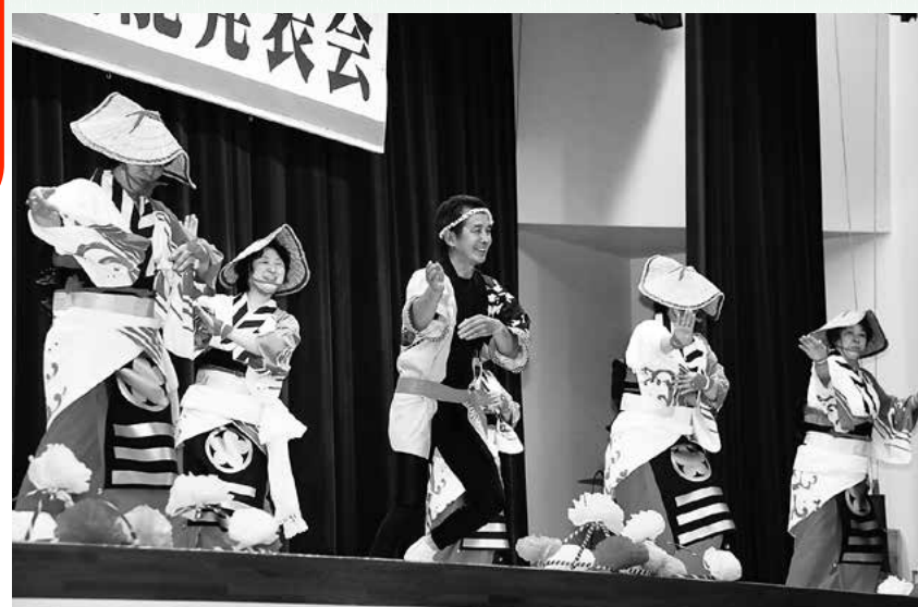
↑色鮮やかな衣装をまとった茂浦民謡同好会