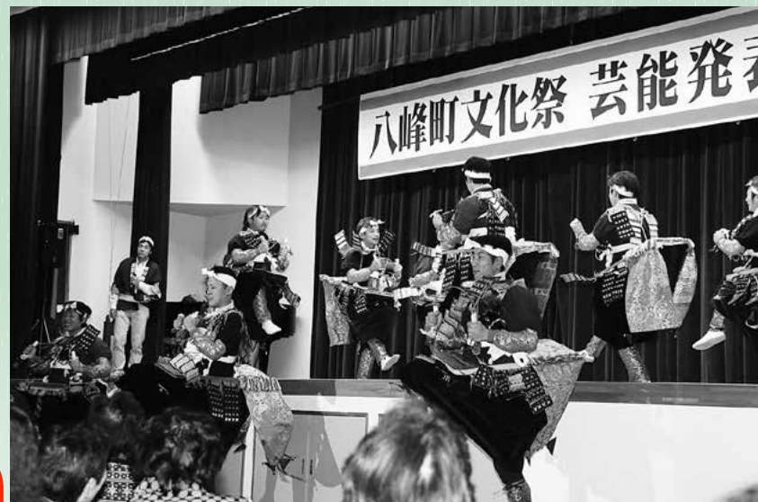
↑今年も大トリを飾った石川駒踊りで観客の興奮は最高潮に！